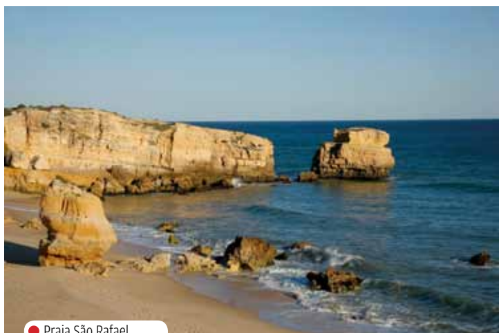
● Praia São Rafael