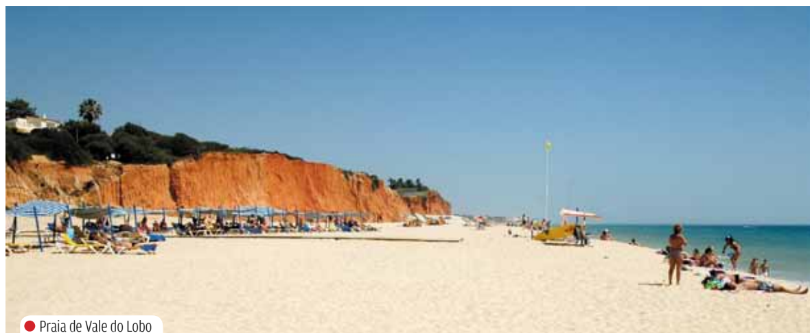
● Praia de Vale do Lobo

Em Lagos, as praias da Luz e D. Ana são referências, assim como a popular Meia-Praia. Antes de chegar a Portimão, a Prainha, entre