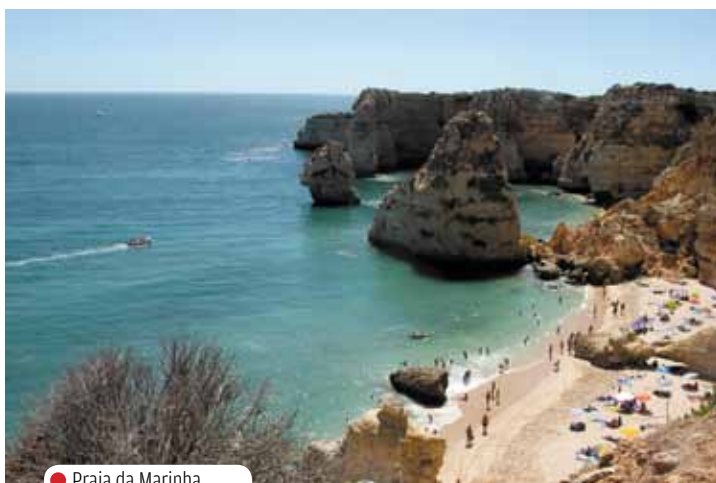
● Praia da Marinha