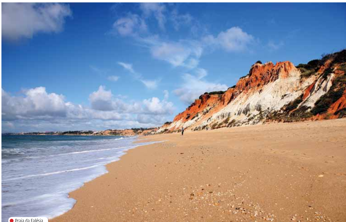
● Praia da Falésia

do Lago e Vale de Lobo. É uma praia de que toda a gente já ouviu falar, porque por lá passam muitas figuras do 'jet set'.