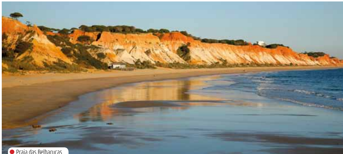
● Praia das Belharucas

Alvor e o Vau, é um pequeno paraíso, ainda que o acesso seja difícil, pois apenas é feito de elevador ou durante a maré baixa. Na cidade do Arade, opções mais fáceis são a Praia dos Três Castelos ou a do Barranco das Canas, ainda que mais lotadas.