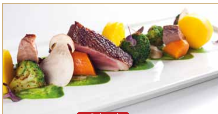
O Leão de Porches