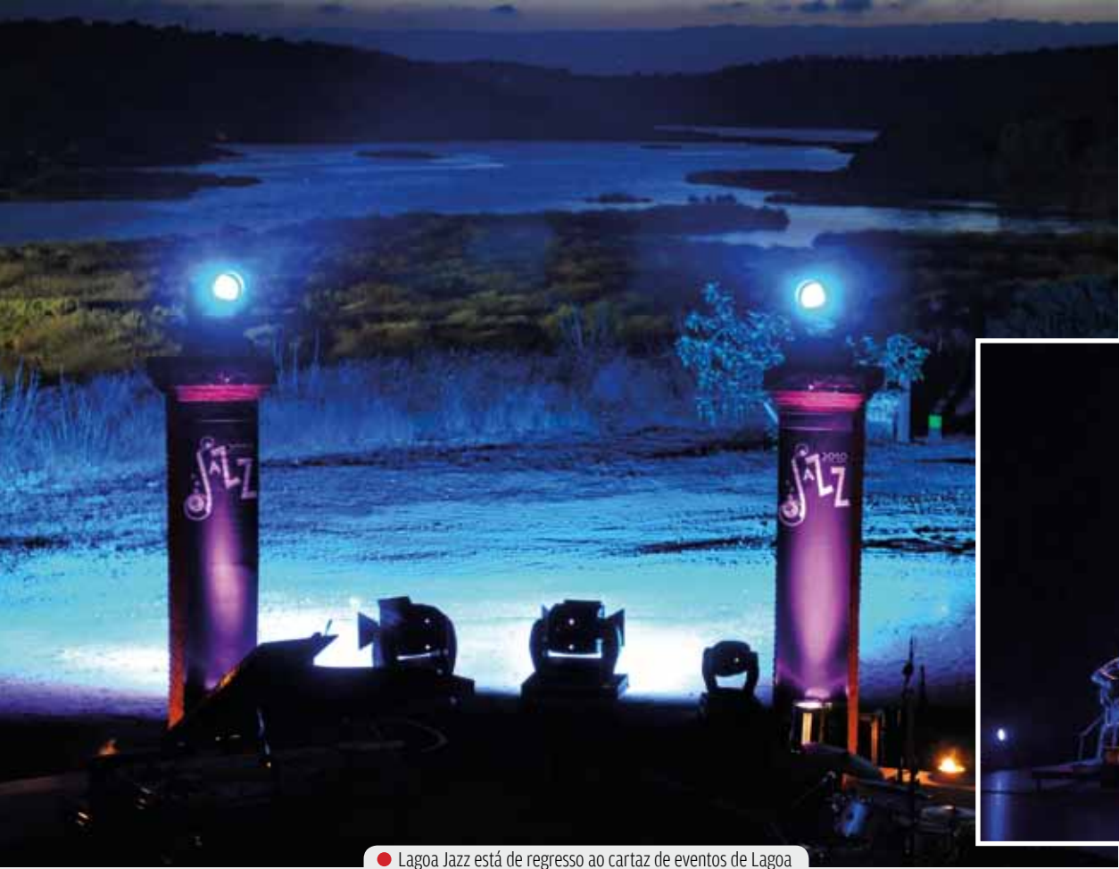
● Lagoa Jazz está de regresso ao cartaz de eventos de Lagoa