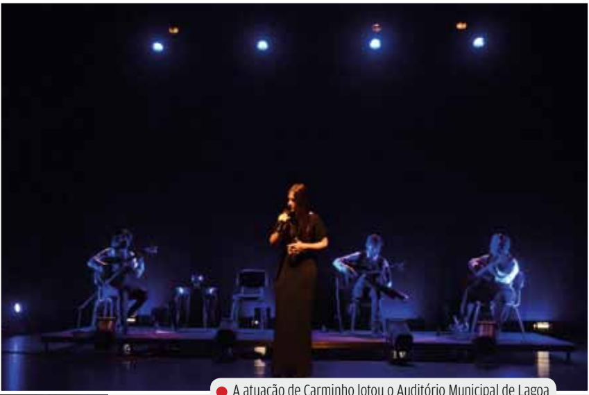
● A atuação de Carminho lotou o Auditório Municipal de Lagoa

após dois anos de ausência, e os Sons do Atlântico, um festival de músicas do mundo. O primeiro vai acontecer em junho, como era hábito desde sempre, estando agendada para os dias 5,6 e 7. Esta foi ao longo dos anos uma das grandes referências culturais do concelho, atraindo sempre muito público estrangeiro, e mantendo ao longo do tempo um público fiel. O regresso será seguramente muito saudado.