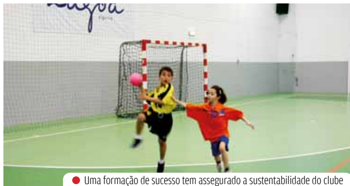
● Uma formação de sucesso tem assegurado a sustentabilidade do clube