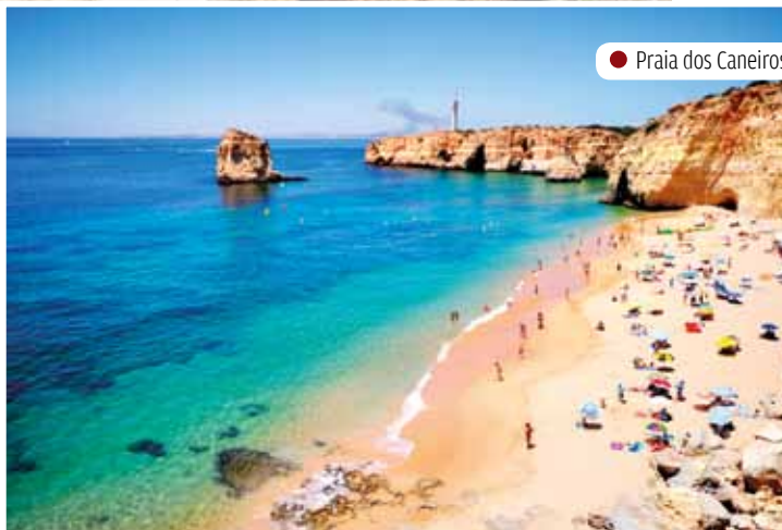
● Praia dos Caneiros

DEPOIS DA DISTINÇÃO DA BANDEIRA AZUL, AS PRAIAS DO CONCELHO RECEBEM 'QUALIDADE DE OURO'