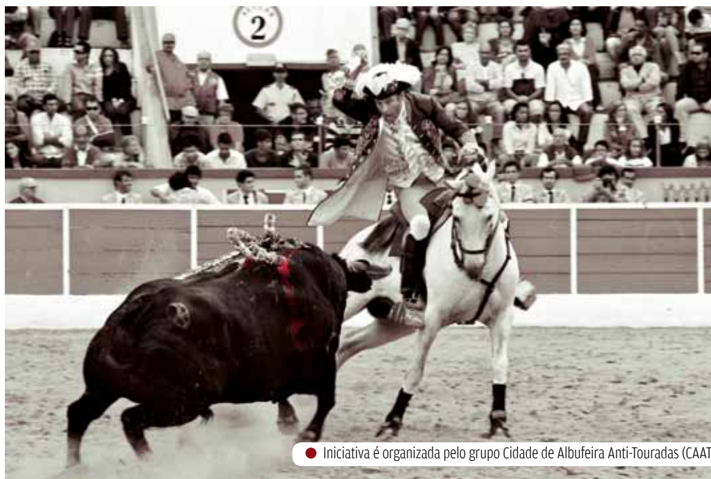
● Inicialmente é organizada pelo grupo Cidade de Albufeira Anti-Touradas (CAAT)

Grupo local apela à participação das pessoas