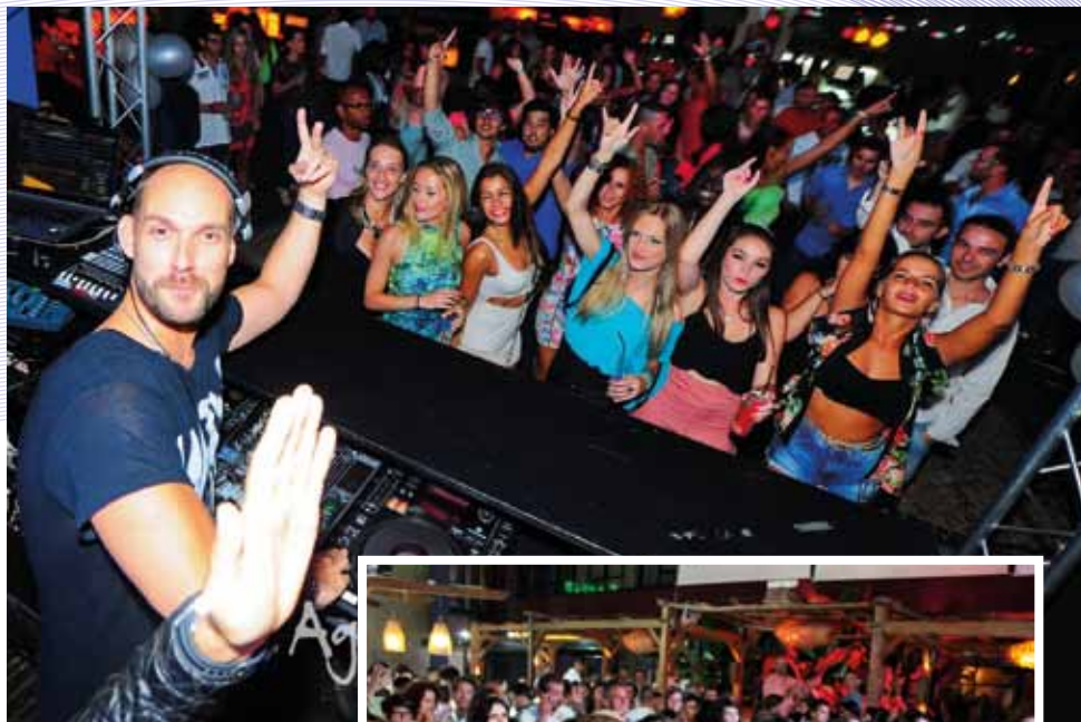
Água Moments Vilamoura

Julho já foi um pouco assim, mas é neste mês de agosto que as noites algarvias atingem o seu auge. Água Moments, Bliss e Seven (Vilamoura), Nosolo Agua e MeoSpot (Praia da Rocha) são alguns dos espaços mais badalados e onde poderá encontrar as caras mais bonitas, as peles mais bronzeadas e muitos famosos. Palms (Quinta do Lago), Le Club (Albufeira) e Manta Beach (Monte Gordo) são outros locais de referência este verão e, em Ferragudo, o Rei das Praias vai continuar a proporcionar agradáveis festas temáticas às sextas-feiras. As festas 'sunset' são a última moda e vão decorrer nos mais diversos espaços de animação da região, prometendo finais de tarde diferentes, mas sempre alegres e entusiastas. A Algarve Vivo passou, em julho, por alguns destes locais e mostra-lhe só um bocadinho da festa e da loucura que poderá desfrutar ao longo deste verão na região mais animada do país.