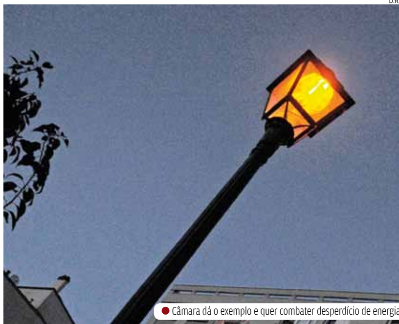
● Câmara dá o exemplo e quer combater desperdício de energia