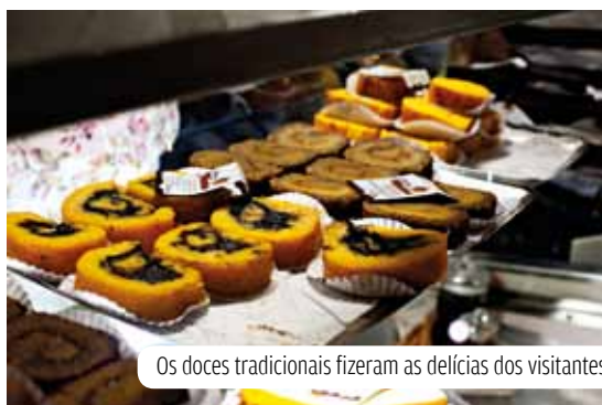
Os doces tradicionais fizeram as delícias dos visitantes