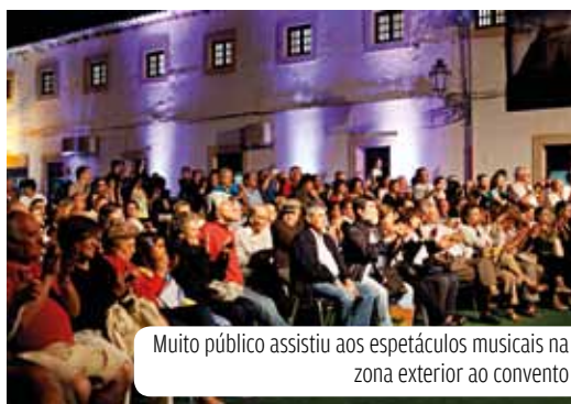
Muito público assistiu aos espetáculos musicais na zona exterior ao convento