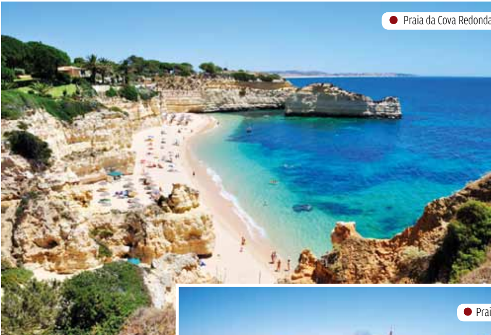
● Praia da Cova Redonda