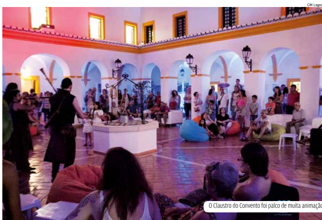
O Claustro do Convento foi palco de muita animação

evento, o Convento de S. José, um edifício setecentista que tem contribuído para a difusão de cultura no município, através de exposições e diferentes eventos.